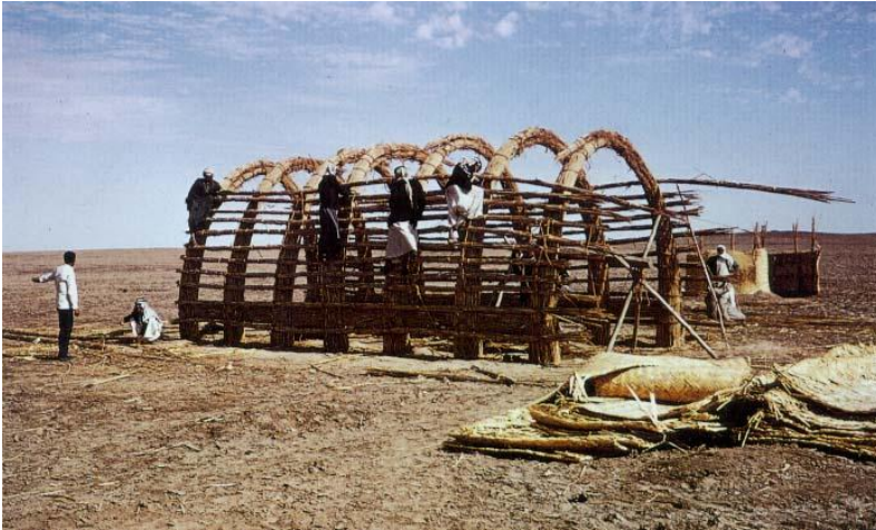
Figure 4 or confederations of tribes such as the Al Bu Muhammad, Ferayghat, Shaghanbah and Ban Lam. These tribes have developed a unique culture in direct interaction with the surrounding environment. In each village, there were two main groups, defined according to their main occupation: the first group was in charge of the breeding of buffalo, an animal introduced into the region during the 3 rd millennium BC and perfectly adapted to the marsh. The second group cultivated rice, barley, wheat and pearl millet

Sumerian sites are on the bank of the marshes: Ur, Uruk, Eridu, Lagash and many others, but recent surveys indicate that more sites are available within the marshlands itself. Iraqi Authorities record number of completely unknown site discovered because of the wetlands draining. These sites have never been studied and it is possible that other new sites have not yet been discovered. These sites certainly contain precious information for the understanding of the Sumerian civilization.